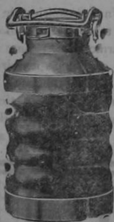
Almacenes al por mayor